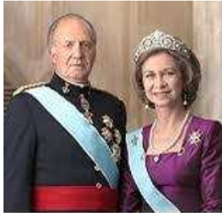
Reyes de España

Del 5 al 10 de junio de 1967, en la Guerra de los Seis Días, Israel se anexiona el Sinaí egipcio, Cisjordania y los Altos del Golán sirios. En esta guerra, la Jerusalén oriental regresa a manos del pueblo judío, y permanece hasta hoy en día.