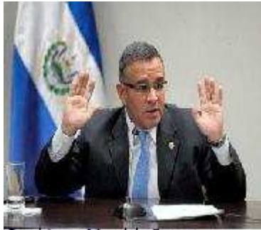
Presidente Mauricio Funes EL SALVADOR

URGENTE: Envíalo a tus contactos y amigos